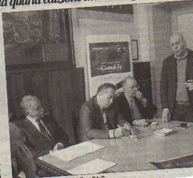
La conferenza stampa di "Com&te"